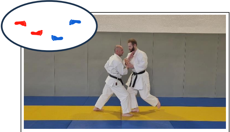
Accentuer la clé en rotation 3 Migi tai sabaki