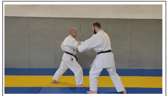
Rotation du poignet saisi, contrôle du coude main G 2 Migi te o uchi mawashi