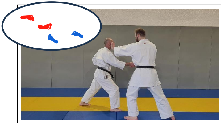
ESQ EXT AV à 45°, atemi « patte d'ours » 1 Yori ashi, hidari han tai sabaki, hidari jodan kizami teicho – Fudo dachi