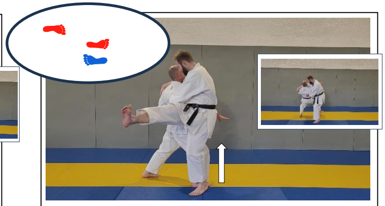
Poussée ARR de la main G, déséquilibre du bassin 4 PROJECTION FAUCHAGE DE LA JAMBE Migi o soto gari