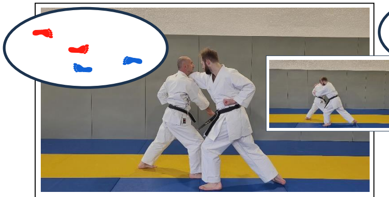
Dégager le poignet, armer BD, atemi avant-bras 3 Kote hodoki, migi jodan gyaku mawashi ude uchi