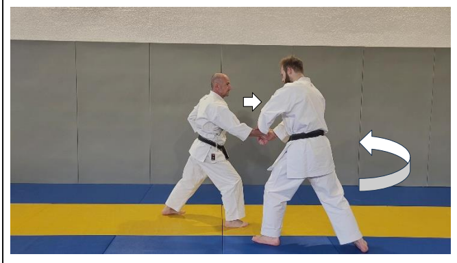
Saisie du poignet main G, déplacement circulaire, 2 Migi kote dori