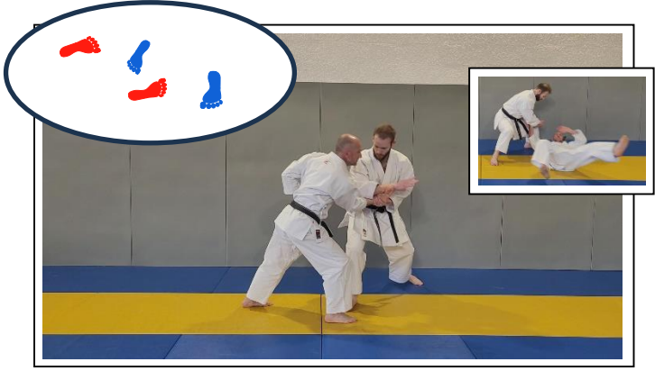
CLÉ DE POIGNET EXT avec tranchant (avant-bras), amenée au sol 4 Migi kote gaeshi