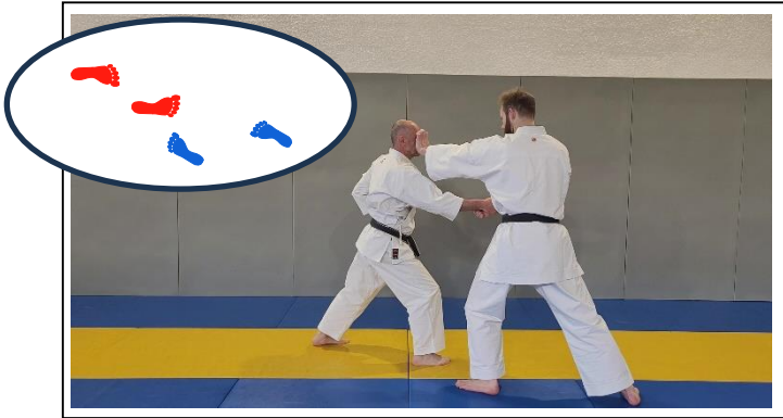
ESQ EXT AV à 45°, atemi « patte d'ours » 1 Yori ashi, hidari han tai sabaki, hidari jodan kizami teisho – Fudo dachi