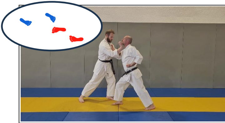
ESQ EXT AV à 45°, atemi « patte d'ours » + tranchant creux du coude 1 Yori ashi, hidari han tai sabaki, migi jodan gyaku shita teisho + hidari shuto uchi