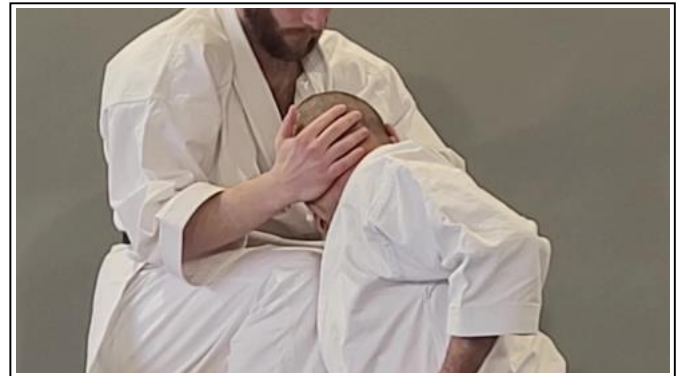
ATEMI DU GENOU D VISAGE Migi jodan hiza geri 4