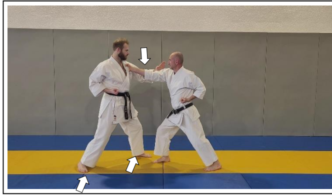
F/ SAISIE D'1 REVERS À 1 MAIN ERI DORI