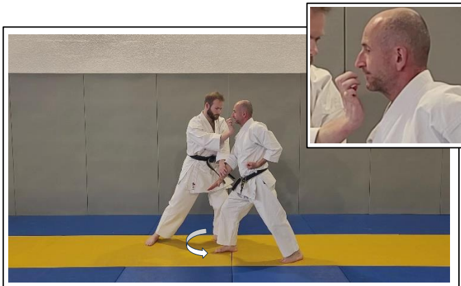
...ATÉMI DE BASE Migi jodan gyaku shita teisho