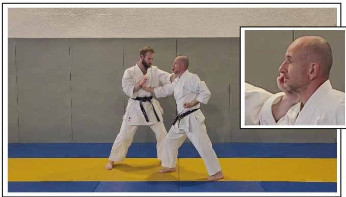
ESQ AV à 45°, atemi « patte d'ours » main G visage Yori ashi, hidari han tai sabaki, hidari jodan kizami teisho