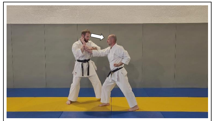
Glisser la main G le long du bras d'Uke, saisie du poignet Migi kote dori