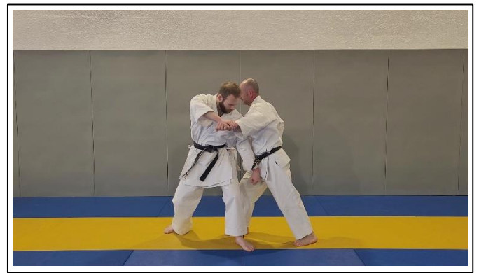
Frappe poing G aux « parties » Hidari gedan kizami tate suki