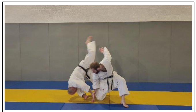
PROJECTION DE BASE Migi kata guruma