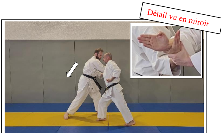
CLÉ DE BASE Migi oyayubi kiwame