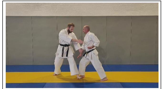
Avancer JG Hidari yori ashi