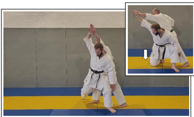
Poser le genou D au sol, tirer avec main D pour déséquilibrer Hidari oshi te, migi hiki te