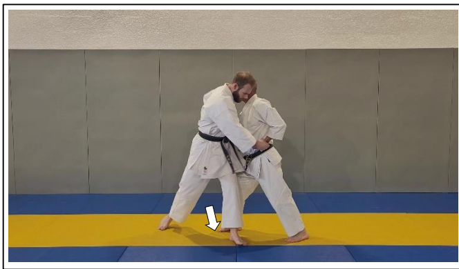
Saisie du poignet G Hidari kote dori