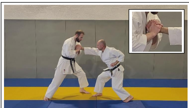
Contrôle du poignet contre le buste et CLÉ DE BASE 3 Migi kote hineri, tate kote osae