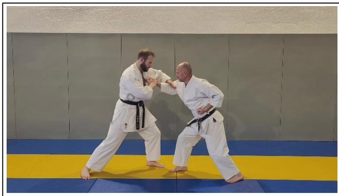
Remettre les hanches de face Koshi o shomen