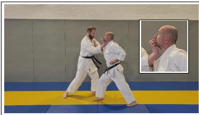
ESQ EXT AV à 45°, frappe « patte d'ours » + tranchant creux du coude 1 Yori ashi, hidari han tai sabaki, migi jodan gyaku shita teisho + hidari shuto uchi