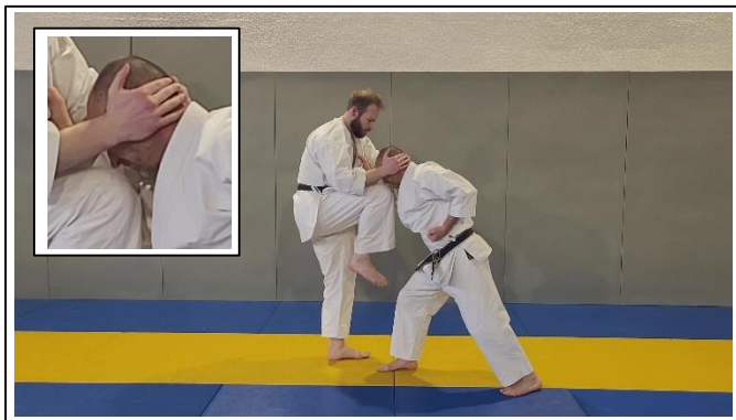
ATEMI DE BASE Migi jodan hiza geri