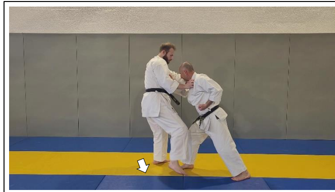
Saisie revers main D, traction Migi te de eri o dori