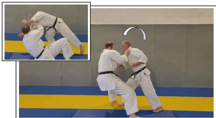
Descendre sur la fesse G en gardant JG tendue Hidari te de hiji o dori