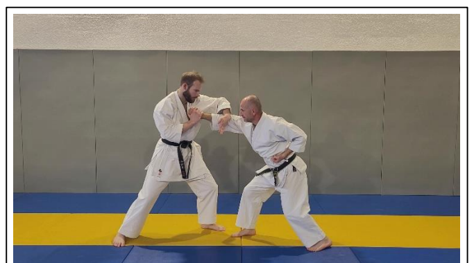
Plier le BD avec tranchant main G 4 Hidari seiryuto uchi