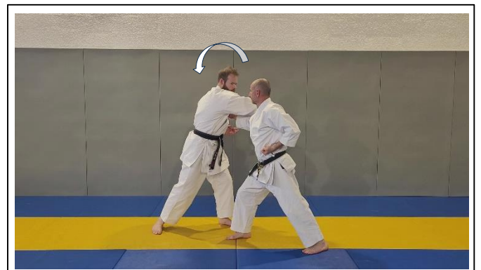
Saisie du poignet à 2 mains, rotation vers la D 2 Migi ryo kote dori