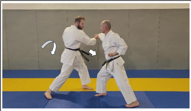
...dégager le poing G, l'armer à la hanche 3 Hidari kote hodoki