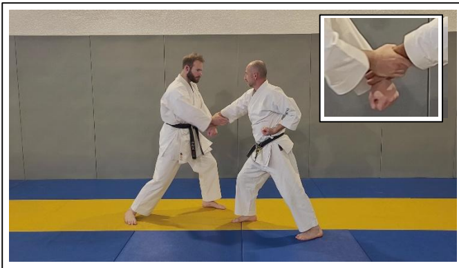
...dessus de main D, saisie du poignet D, traction du bras... 2 Migi kote dori