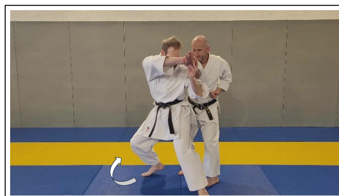
Rotation à 180° par la D 8 Migi irimi tenkan