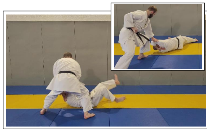
PROJECTION DE BASE 10 Migi shio nage