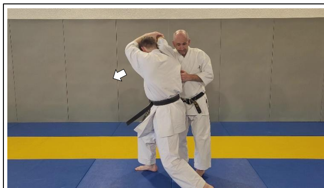
Abaisser le bras en avançant JG 9 Mae otoshi