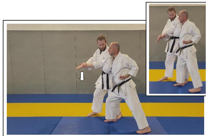
CLÉ DE BASE 6 Migi ude hishigi kannuki gatame/ude gatame