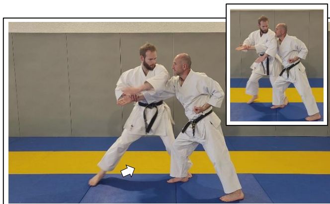
Traction du bras, enrôler le bras 5 Migi ude garami