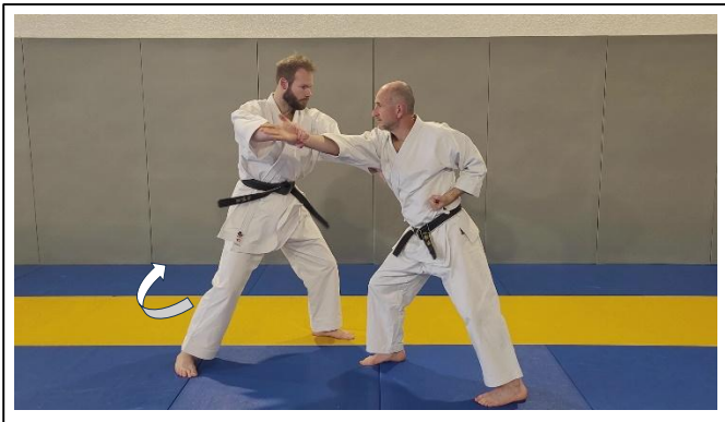
ATEMI DE BASE 4 Migi te de hiru, hidari chudan oi suki