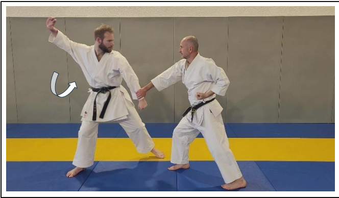
ESQ LAT jambe G, atemi paume « boule de billard » ... 1 Hidari yori ashi, migi teisho uchi