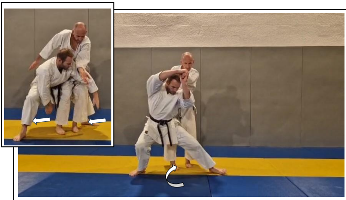
Décaler la JD vers la D puis glisser JG derrière Uke 9 Hidari yoko yori ashi, migi hiki ashi