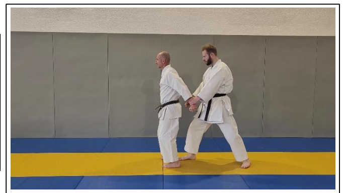
...et avance d'un petit pas JD, puis saisie ARR Migi ashi ayumi ashi, ushiro ryo kote dori