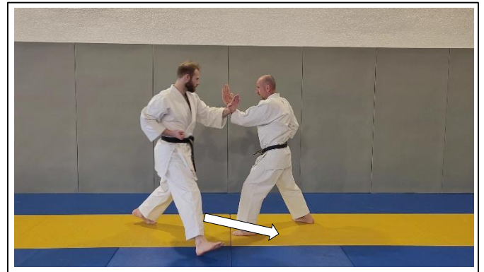
...puis 1 grand pas jambe G... Hidari ashi ayumi ashi