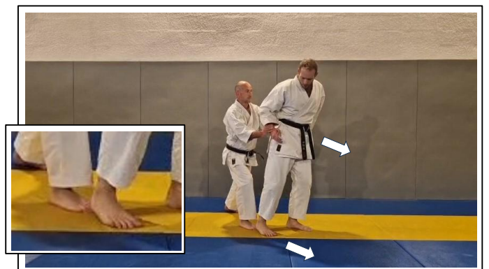
Frappe du talon sur le pied D Migi ushiro fumikomi