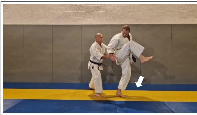
Armer JD Migi ashi o ageru