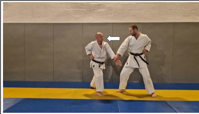
Dégagement poignet G 5 Hidari kote hodoki