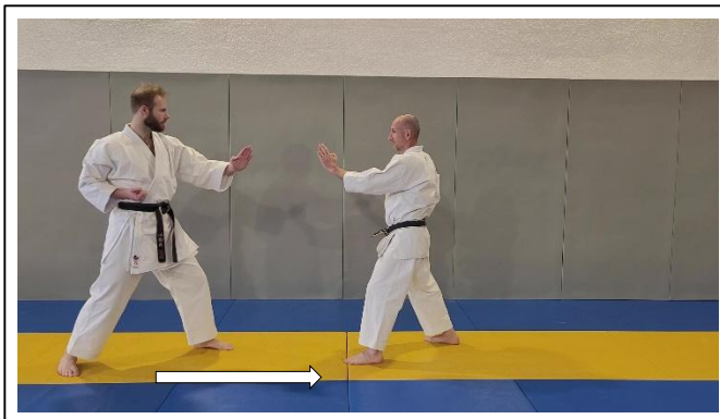
Avancer d'un grand pas JD... Migi ashi ayumi ashi