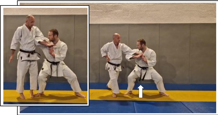
CLÉ DE BASE 8 Hidari hiji hishigi/tenbin gatame