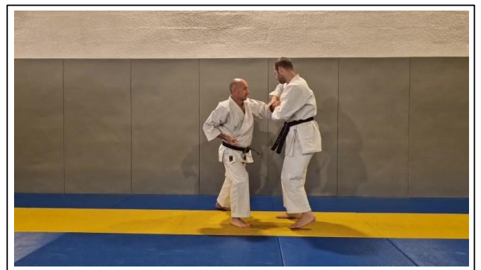
Rotation vers la G Hidari tai sabaki