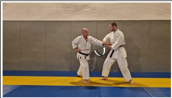
Saisie du poignet en « V » 7 Hidari kote dori