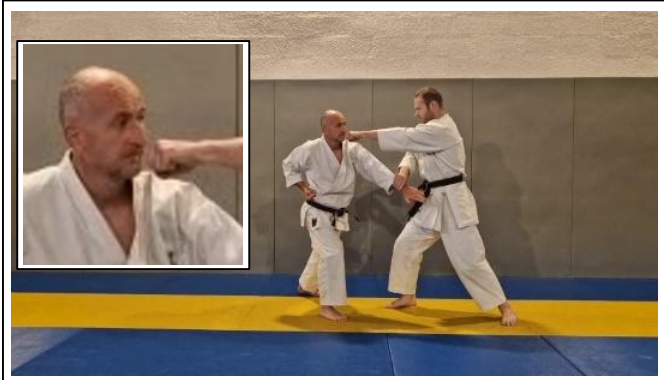
ATEMI DE BASE 6 Hidari jodan gyaku suki