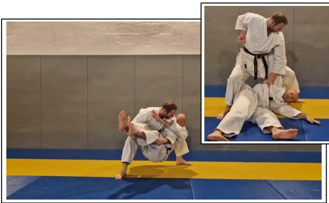
PROJECTION DE BASE 10 Waki otoshi/sukui nage